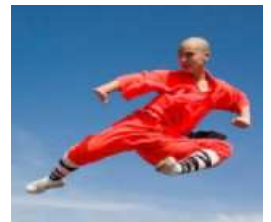
★★★★★ ผีกังฟูขั้นพื้นฐานกับปรมาจารย์แห่งเล้าหลิน★★★★★

เที่ยง รับประทานอาหารกลางวัน ณ ภัตตาคาร บ่าย เดินทางกลับสู่ ซีอาน จากนั้นนั่งตามอัธยาศัยสำหรับการช้อปปิ้ง ค่ำ รับประทานอาหารค่ำ ณ ภัตตาคาร นำท่านเข้าสู่โรงแรมที่ ZI JIN GONG HOTEL หรือเทียบเท่า